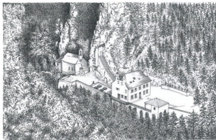
Projet Ermitage de Saint-Privat à Mende

Autant d'éléments qui font de Mende une référence en matière de gestion financière parmi les principales villes d'Occitanie et des départements limitrophes, chiffres officiels à l'appui.