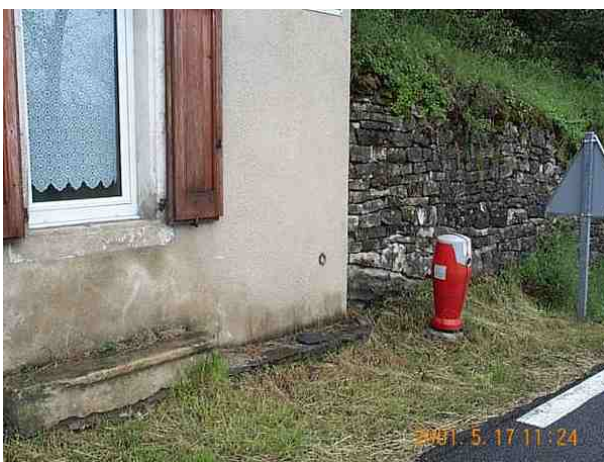
Le repère est au centre de la photo

Remarques : Exploitable par GPS depuis une station excentrée