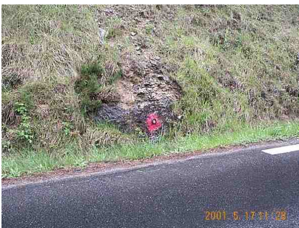
Le repère est au centre de la photo

Remarques : Exploitable par GPS depuis une station excentrée