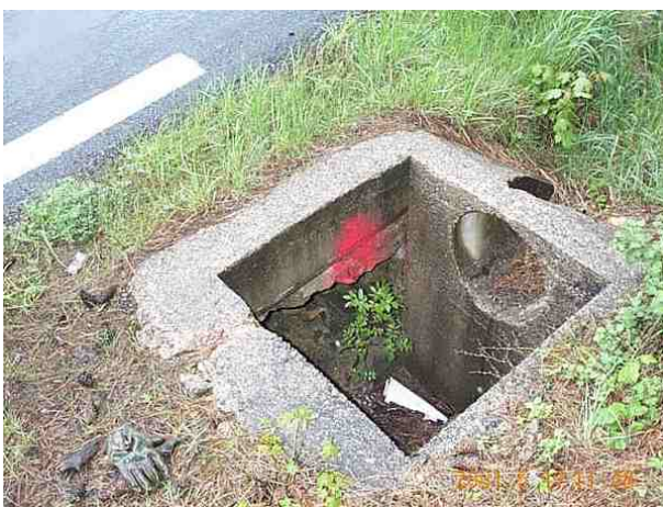
Le repère est au centre de la photo

Remarques : Exploitable directement par GPS