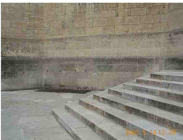
Le repère est au centre de la photo

Remarques : Exploitable par GPS depuis une station excentrée