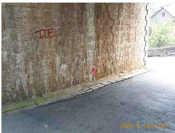
Le repère est au centre de la photo

Remarques : Exploitable par GPS depuis une station excentrée