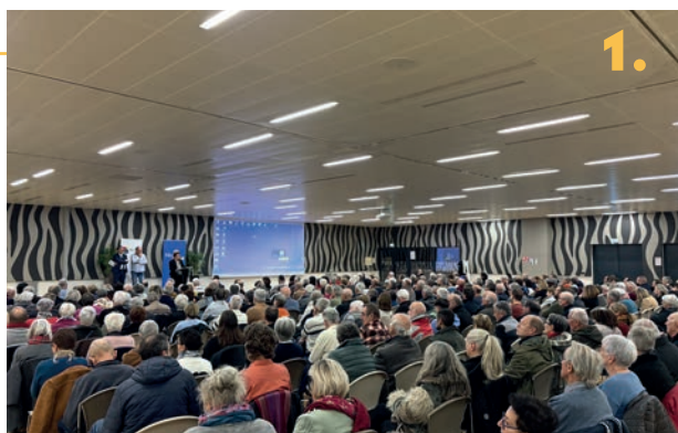
1. Rendez-vous des Mendois à l'Espace Événements Georges Frêche