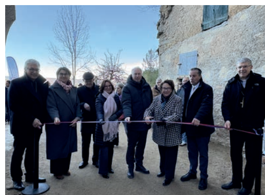
2. Inauguration de la restauration de l'Ermitage Saint-Privat 1 er décembre 2025