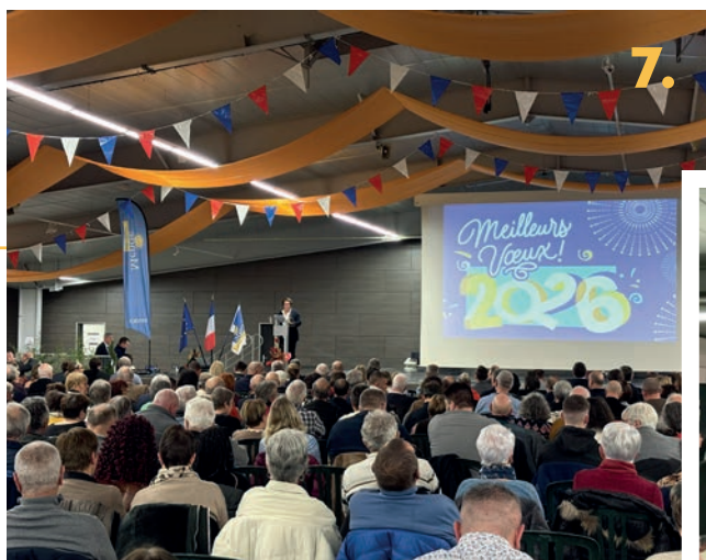
7. Cérémonie des vœux à la population 9 janvier 2026