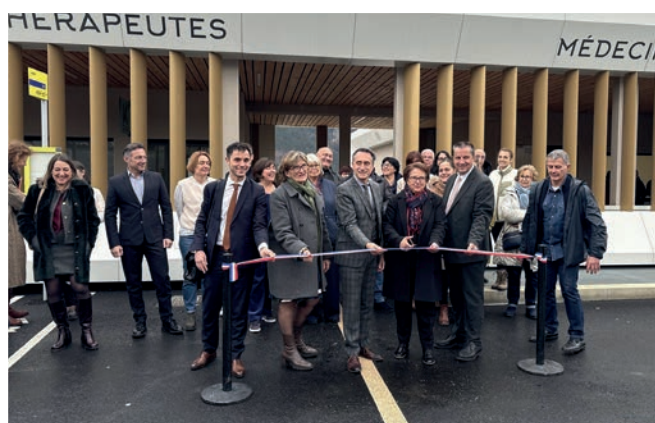
8. Inauguration de la Maison de Santé pluriprofessionnelle