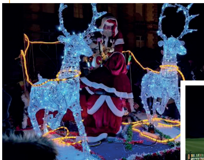
4. Animations et festivités de Noël Décembre 2025