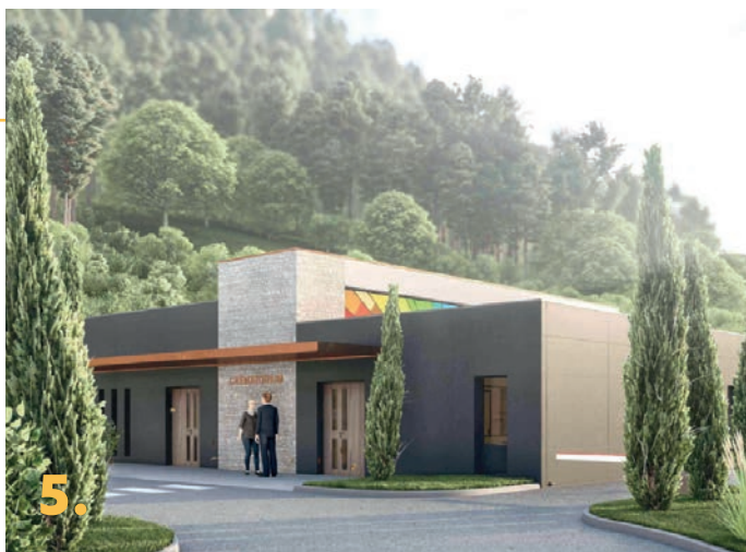
5. Pose de la 1 ère pierre du Crématorium 8 décembre 2025